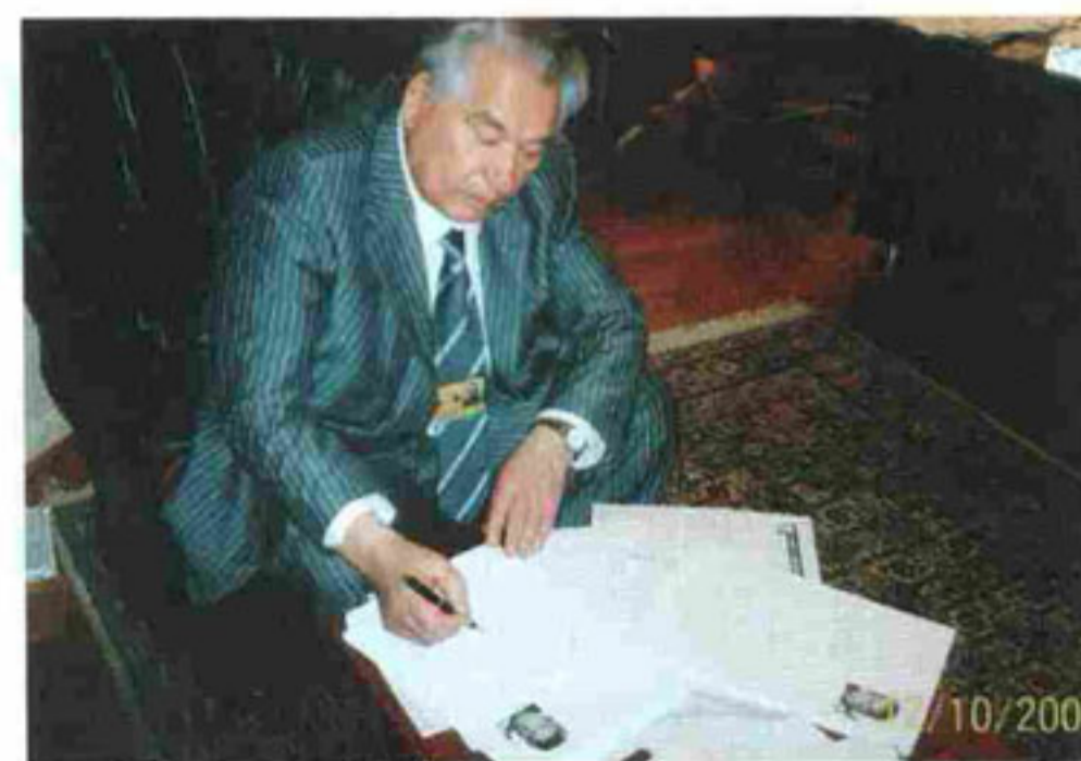
Автограф-сессии А. Джигарханяна, Б. Ефимова и Ч. Айтматова.