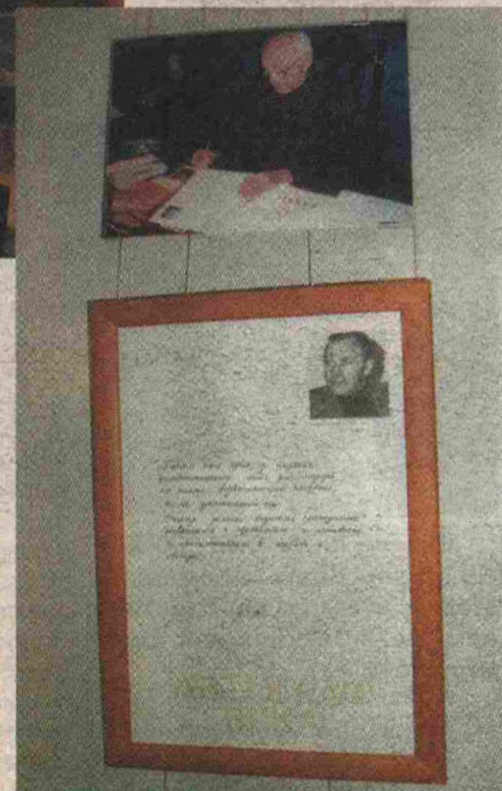
Так выглядит личная страница Михаила Ульянова